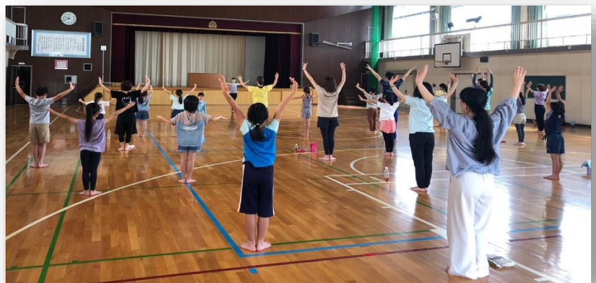
バレトンインストラクター